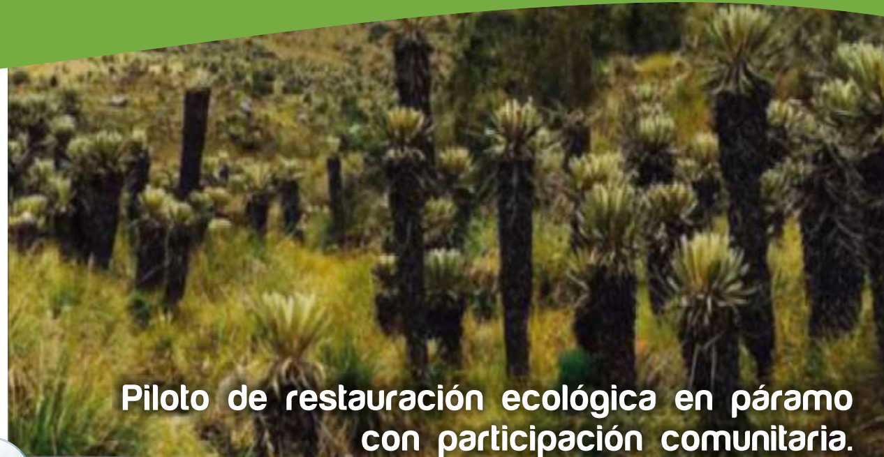
Piloto de restauración ecológica en páramo con participación comunitaria.