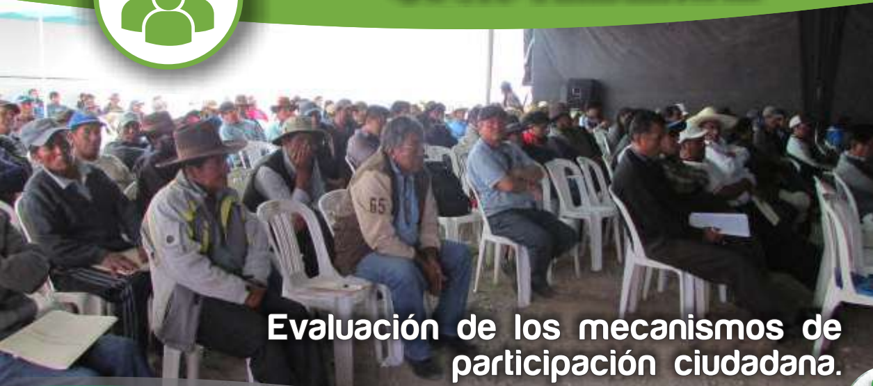
Evaluación de los mecanismos de participación ciudadana.